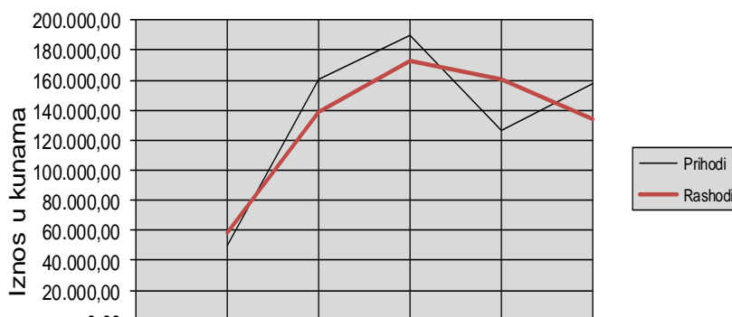
UDRUGA SRMA - REZULTAT POSLOVANJA PO BILANCI 2006.-2010.